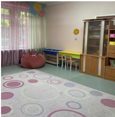
Кабинеты учителей – логопедов, учителя-дефектолога